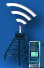
Digital Trunked Radio System : DTRS