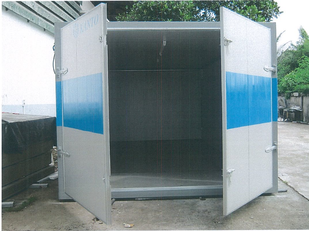
รูปที่ 1 ตัวอย่าง ตู้بانประตูดสาหกรรม มีประตูเปิด 2 บาน