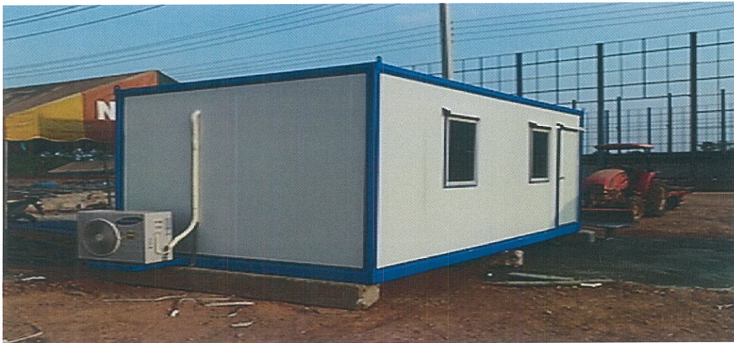
รูปที่ 2 ตัวอย่าง ตู้بانประตูปกติ มีประตูเปิด 1 บานและหน้าต่าง 2 บาน