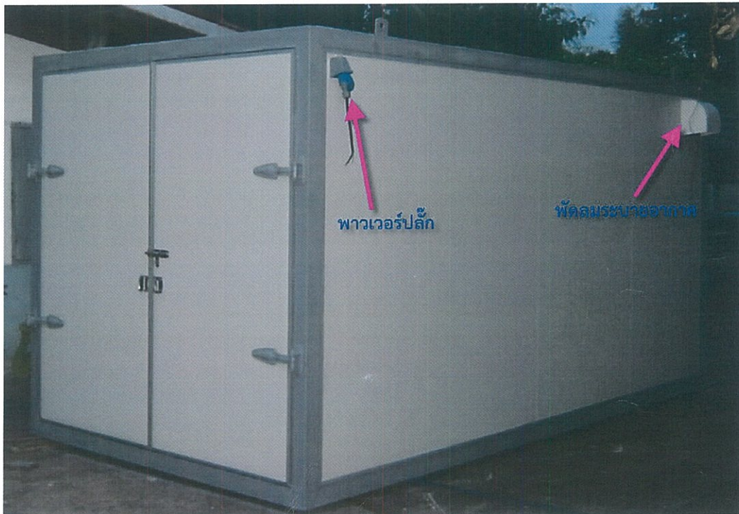
รูปที่ 4 แสดงจุดเชื่อมต่อพาวเวอร์ปลั๊ก และจุดติดตั้งพีดลมระบายอากาศ