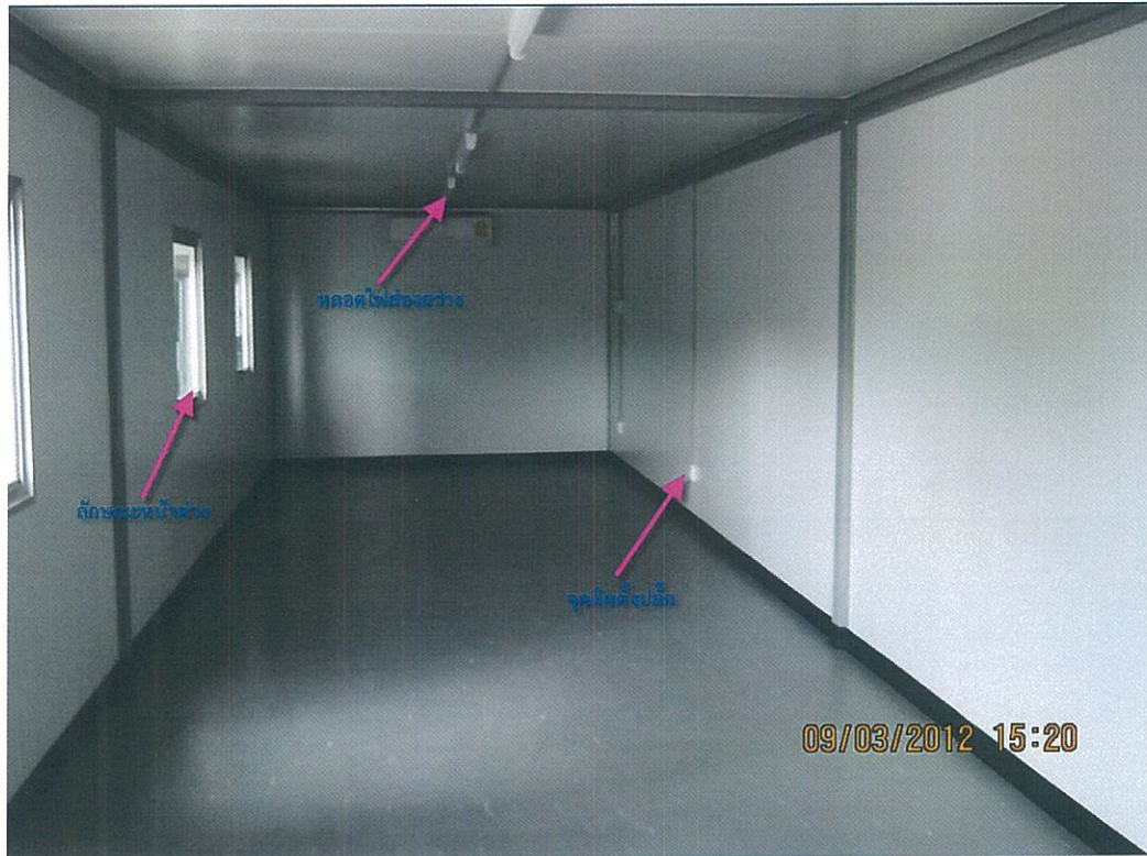
รูปที่ 3 การติดตั้งไฟฟ้าส่องสว่างและปลั๊ก ภายใน